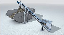
[Norsk] Sketch Ro8